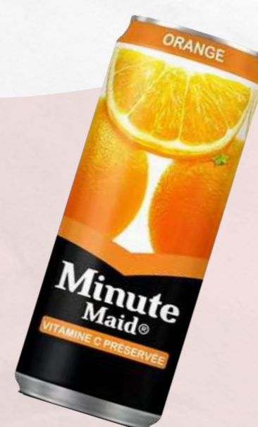
Jus orange Minute Maid 33cl