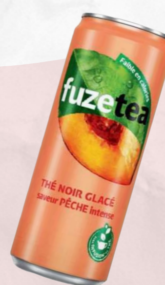
Fuze Tea 33cl