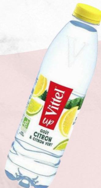
Vittel citron 50cl