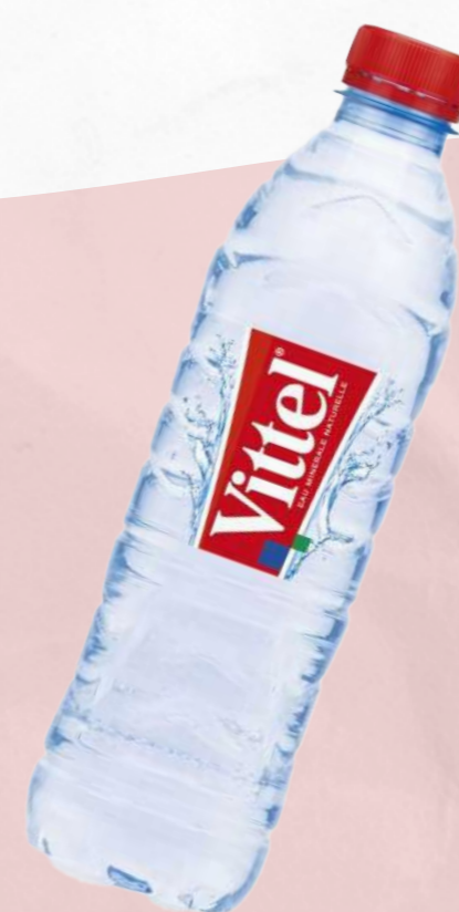
Eau Vittel 50cl