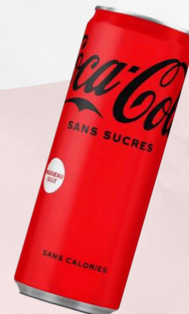
Coca-Cola sans sucre 33cl