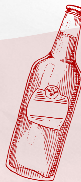
Jus de pommes d'Anjou 33cl